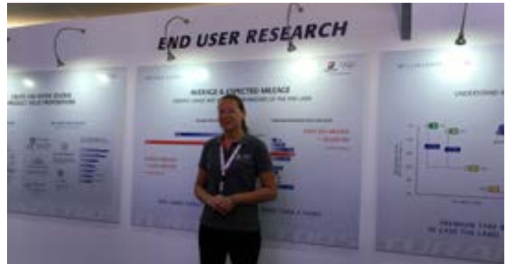
Ruim 25.000 respondenten gaven hun mening

ondervraagden in 7 verschillende Europese landen werden bijeengebracht, geanalyseerd en vervolgens geïmplementeerd in de verdere ontwikkeling van de T005.