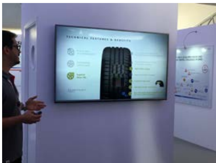
Bridgestone Turanza - Tom Joy

Om de kortere remafstand en de optimale rijstabiliteit te waarborgen ontwikkelden ze een nieuwe rubbermix bestaande uit de Bridgestone "NanoPro-tech" technologie in combinatie met een vernieuwde hoog silica compound. Wat bovendien, volgens Bridgestone, de levensduur van de Turanza T005 met zo'n 10% verlengt t.o.v. de T001 EVO en men bij "normaal" gebruik zo'n 50.000 km op de teller kan zetten alvorens de T005 aan vervanging toe is. De hertekening van het loopvlak, een verbeterde waterafvoer vanuit de centrale loopvlakgroeven, de bredere zijgroeven in de schouderblokken, de stijvere karkasstructuur en de afgeschuinde lamelgroeven die een verbeterde grip en contact bieden zorgen ervoor dat T005 als beste uit de klas kwam bij de TÜV testen inzake remmen op nat wegdek en het natte bochten werk.