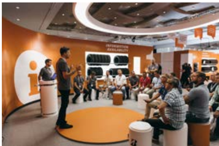
Database beheer als stokpaardje

De Bridgestone Turanza T005 is vanaf januari 2018 verkrijgbaar. Bridgestone voorziet dat nog vóór 2019 er in totaal 140 maten voor de diameters van 14 t/m 21 inch voorhanden zijn. Audi, Mercedes kozen alvast deze nieuweling als eerste uitrusting van hun voertuigen.