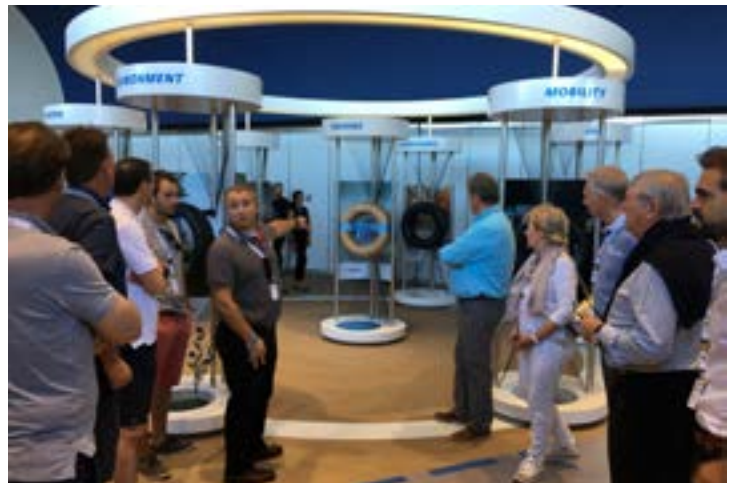
Ook de Belgische vakhandel was prominent aanwezig.

Wel is men dus overtuigd dat de betrokkenheid van de partners, lees groothandels en dealers, effectief moet vergroten om de volumestijging in de Europese markt te realiseren. Partnerschap en consolidatie is meer dan ooit aan de orde. Met de komst van nieuwe fabrieken in Turkije en Rusland en de herschikking van enkele lokale marktunits wil men o.a. het probleem van bevoorrading, stockage en de traditionele winterpiekperiode opvangen. Nog sneller kunnen inspelen en adequater kunnen bevoorraden is ook voor de Japanse fabrikant een enorme uitdaging.