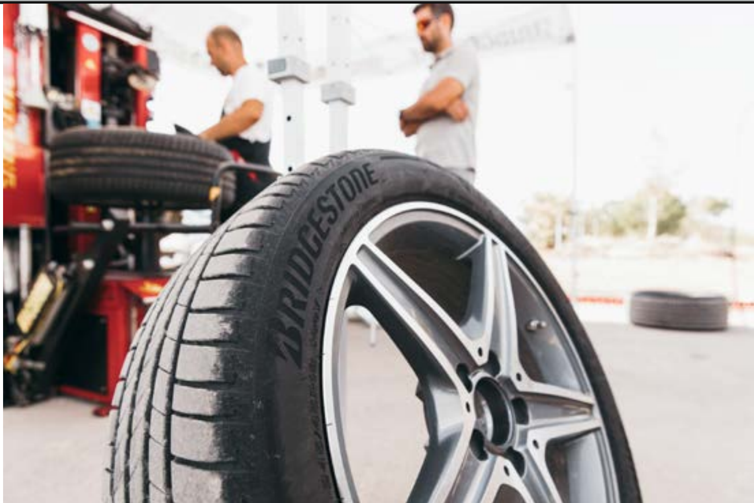
Extra brede lamellen